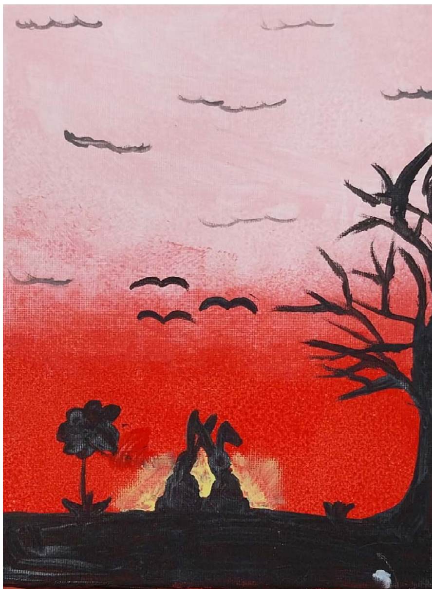
Práce žákyně čtvrté třídy – malba plátno