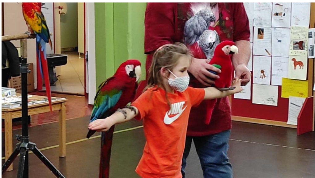
Papoušci v aule školy