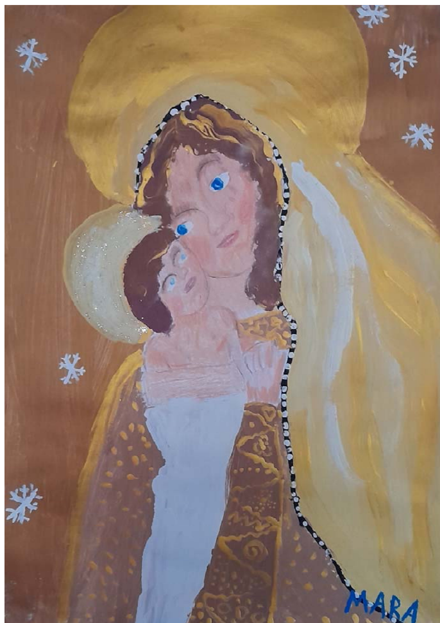
Práce žákyně výtvarného kroužku