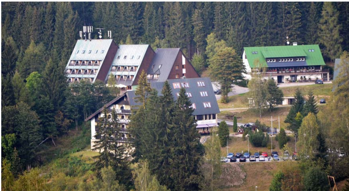
Park Hotel Harrachov

Počasí nám přálo po celou dobu našeho týdenního pobytu, a proto jsme trávili většinu času venku v překrásné okolní přírodě. Sbírali jsme a sušili houby, navštívili Hornické muzeum, vyšlapali na vrcholek Čertovy hory, došli k Mumlavskému vodopádu, občerstvili se po výslapu v kiosku Růžohorky pod Sněžkou a navečer si hráli na dětských hřištích u hotelu.