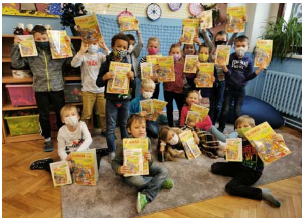
Hurá - první slabikář