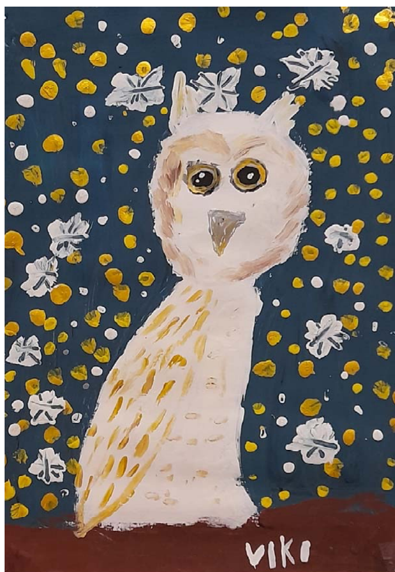
Výtvarná práce žákyně 4. třídy