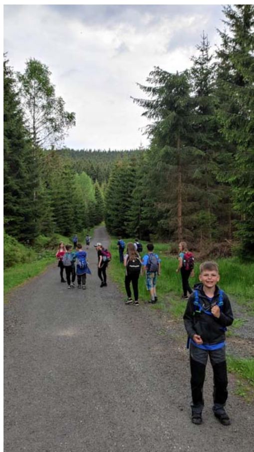
cesta k Černé skále