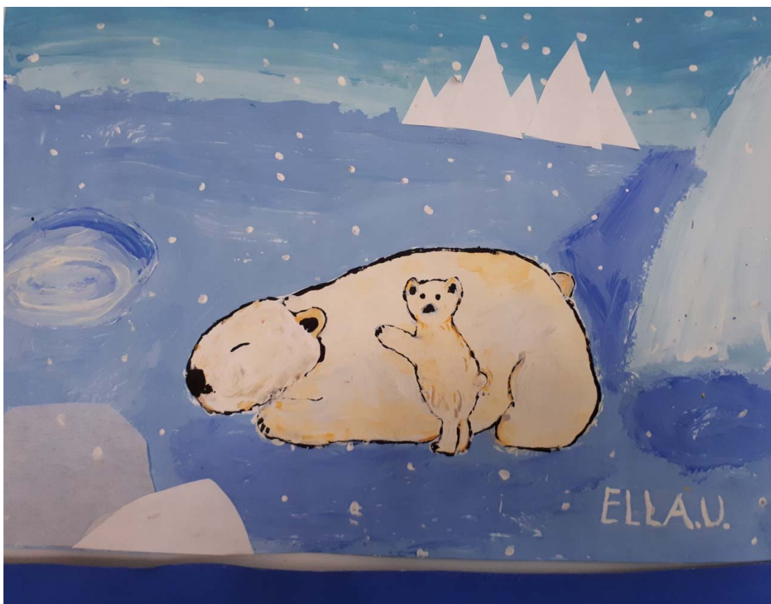
Výtvarná práce žákyně 3. třídy