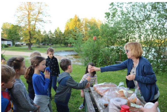
...fronta na buřty ...