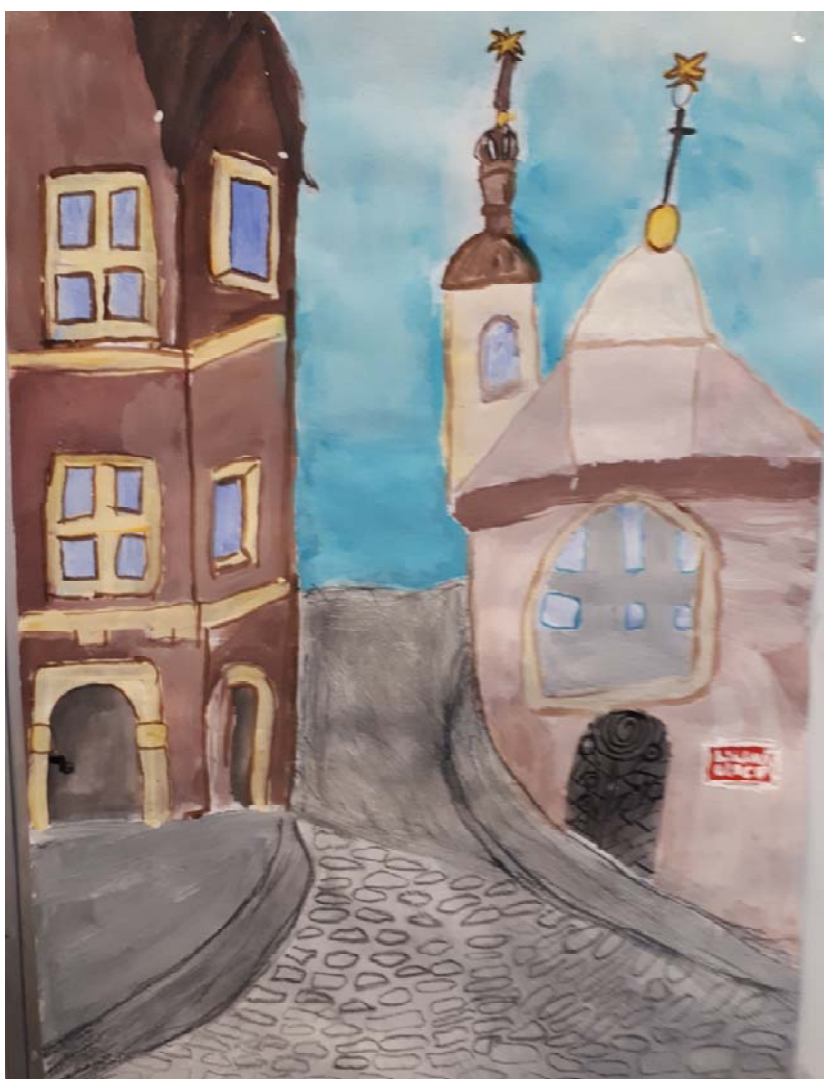
Práce žáka výtvarného kroužku